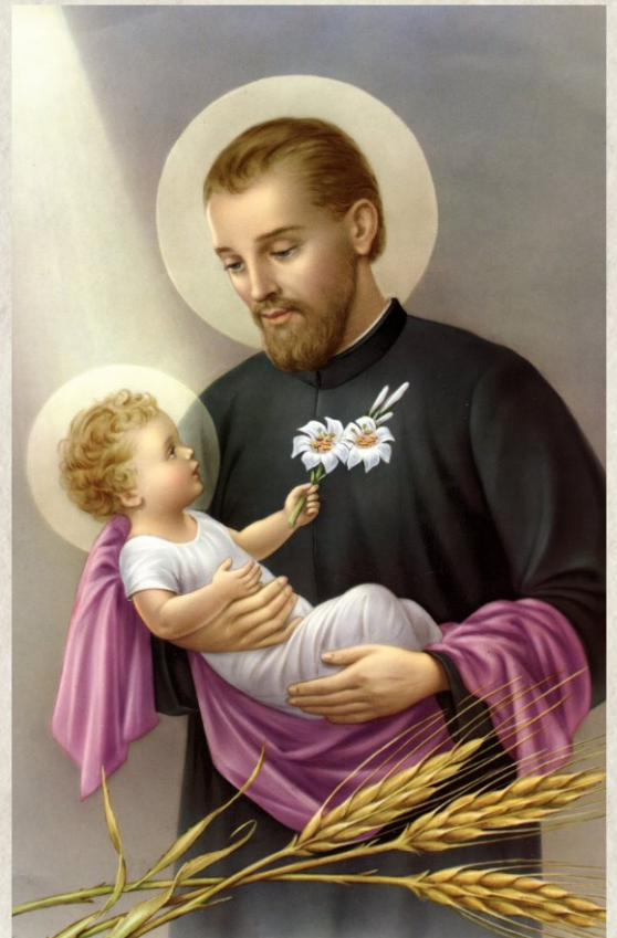
St. Cajetan (arriba)

Al reflexionar sobre la dignidad del trabajo y los derechos de los trabajadores (pág. 5), nuestra fe nos llama a ver a Cristo en los más vulnerables y a servir a quienes tienen necesidad. Estamos llamados a defender la justicia, apoyar a los marginados y acompañar a quienes ven su dignidad ignorada. Al hacerlo, seguimos el ejemplo de San Francisco de Asís, quien se